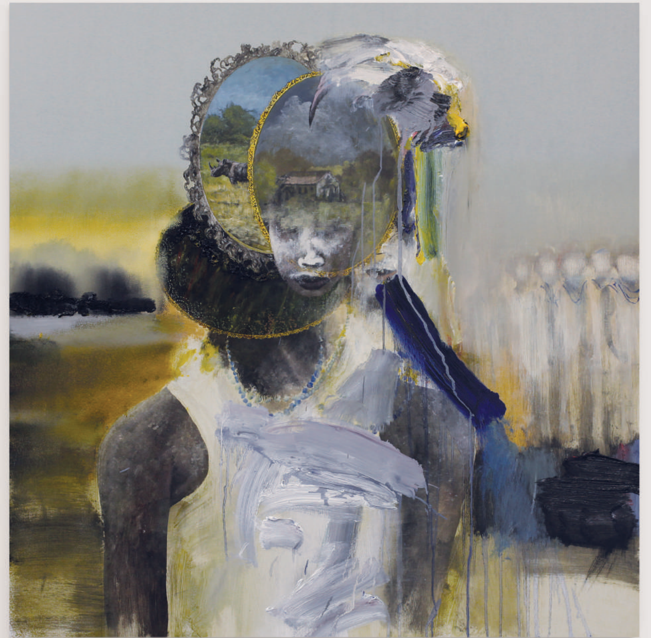
GIRLS OF THE SIERRA LEONE II oil, acrylic, pencil on primed wood panel . 92 x 92 cm | 36 x 36 in