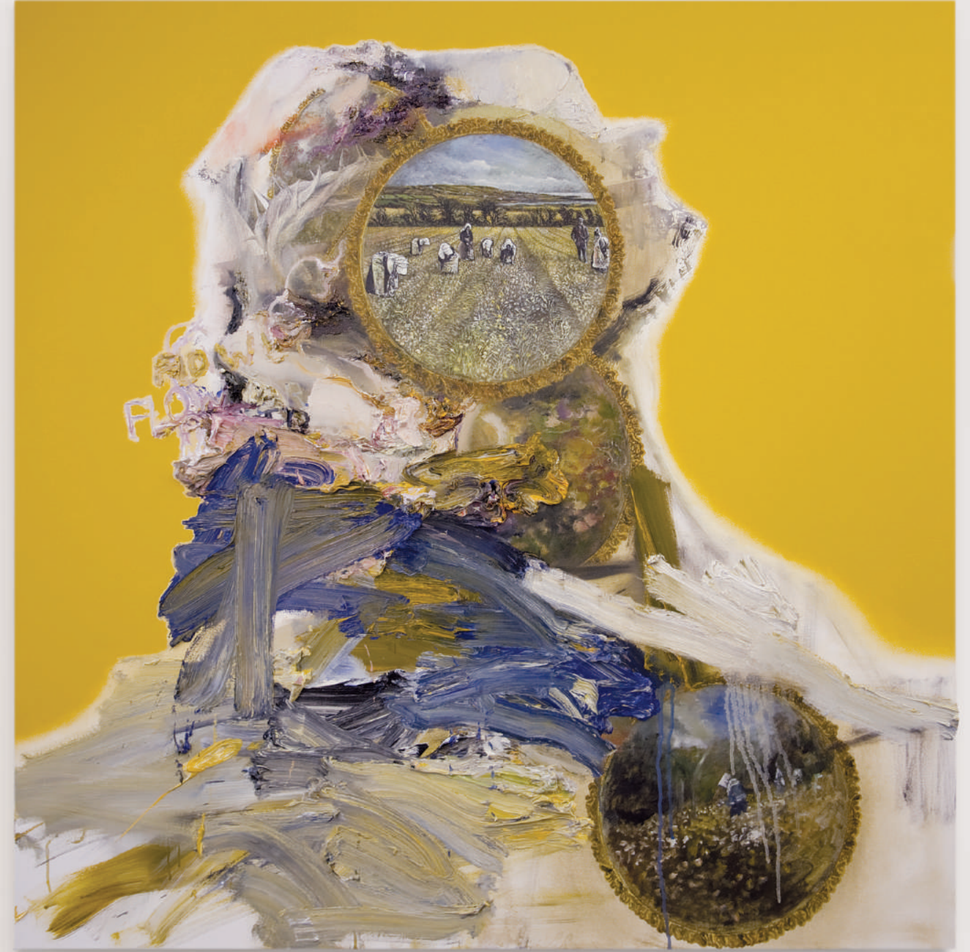
THE FLOWER PICKER

oil and acrylic on canvas . 122 x 122 cm | 48 x 48 in