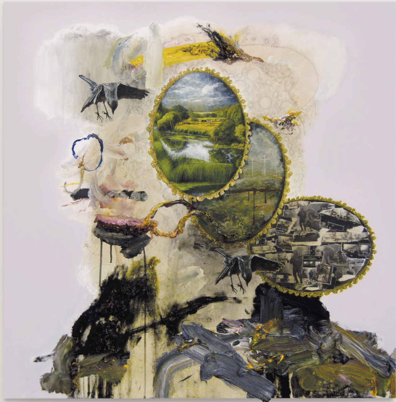
PORTRAIT FOR HUMAN PRESENCE (MONOMATHERBETH) oil, acrylic, collage, pencil on primed wood panel . 92 x 92 cm | 36 x 36 in