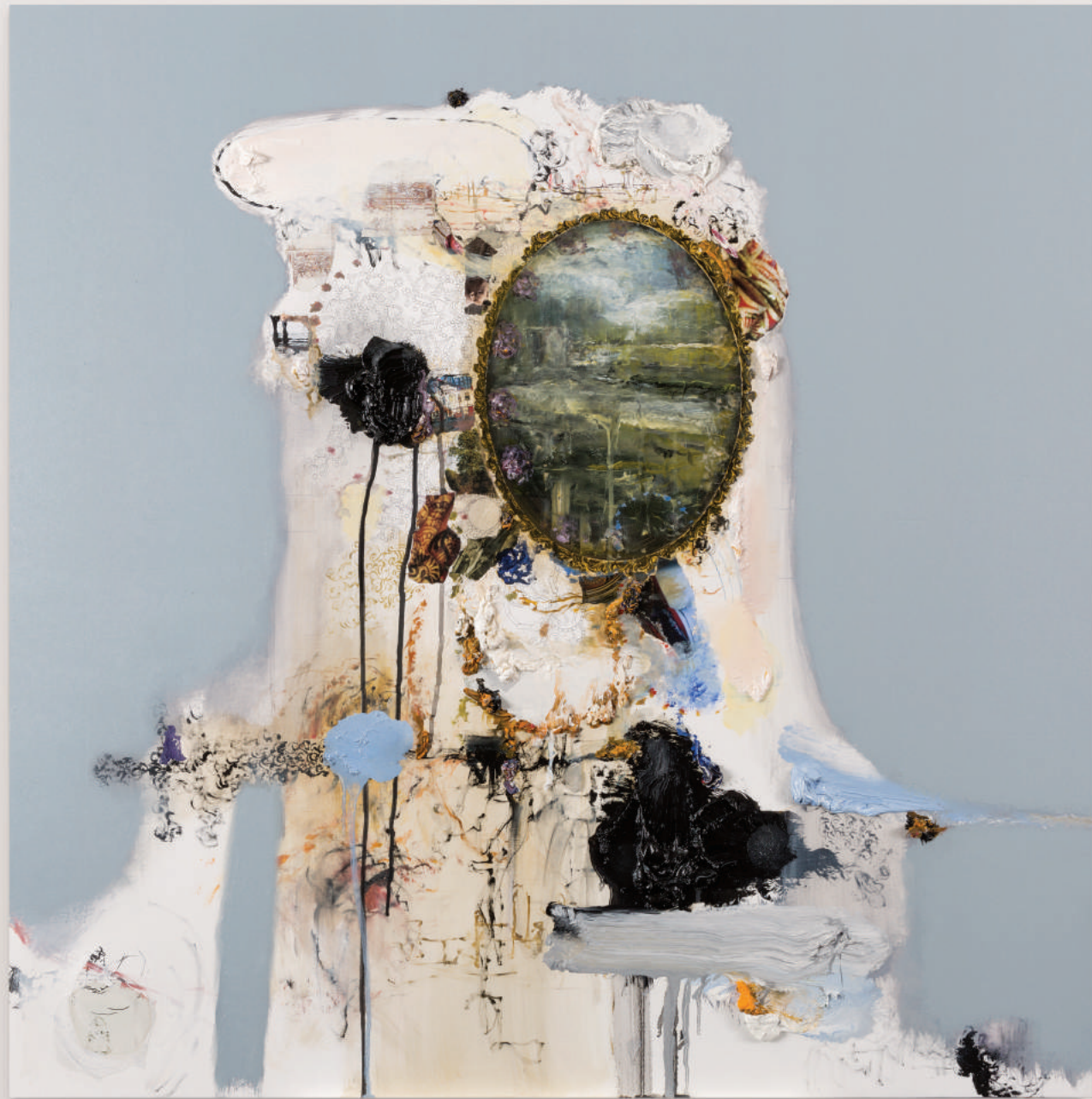
PORTRAIT FOR HUMAN PRESENCE (III)

oil, acrylic, collage, pencil on primed wood panel . 92 x 92 cm | 36 x 36 in