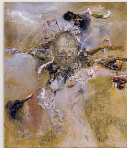
WHERE DEVILS THROW THEIR DICE oil, acrylic, pencil on canvas 30 x 25 cm | 12 x 10 in