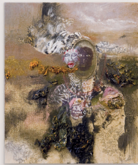
YOUR STORY, YOUR BODY oil, acrylic, pencil on canvas 30 x 25 cm | 12 x 10 in