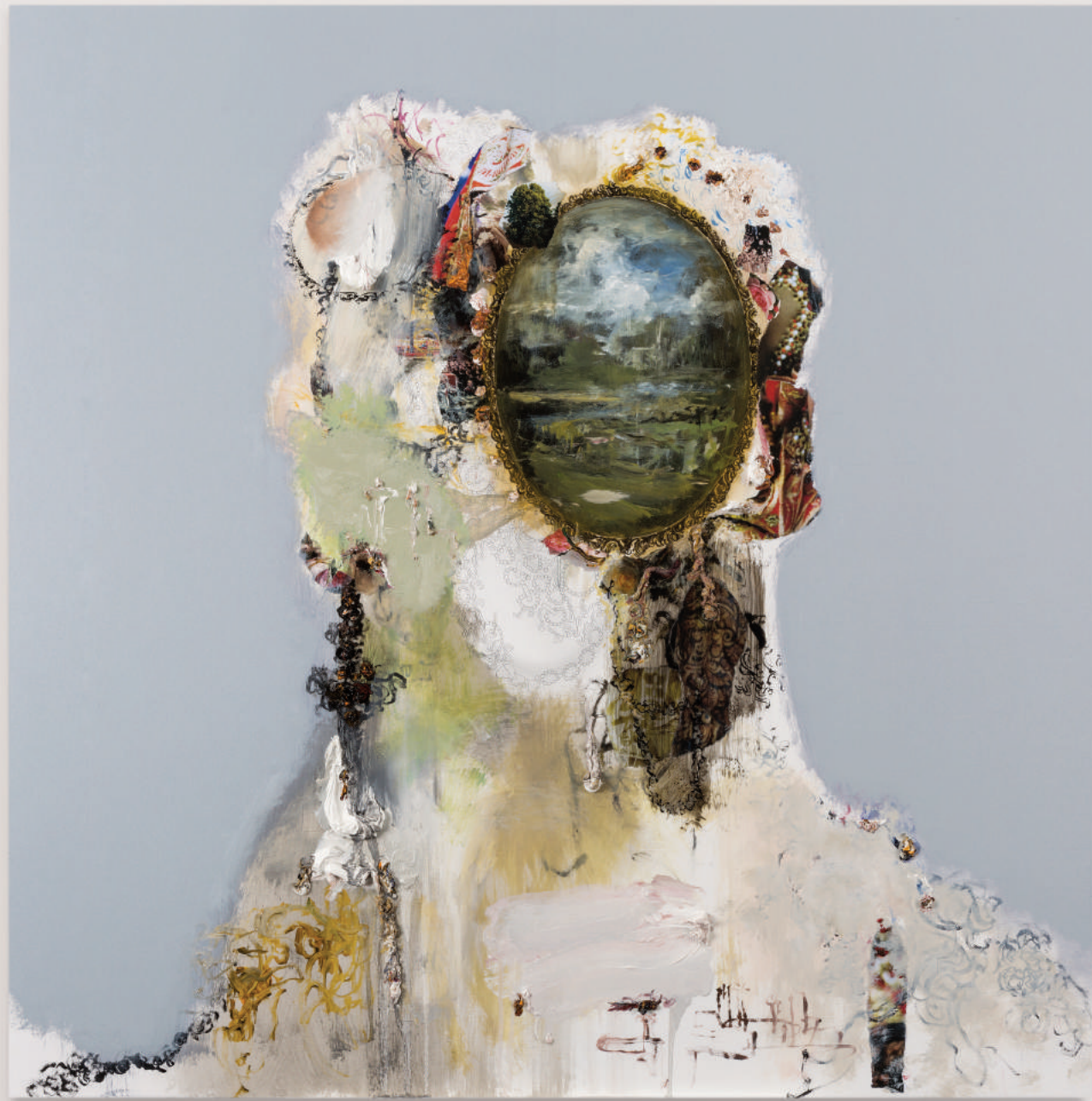
PORTRAIT FOR HUMAN PRESENCE (I)

oil, acrylic, collage, pencil on primed wood panel . 92 x 92 cm | 36 x 36 in