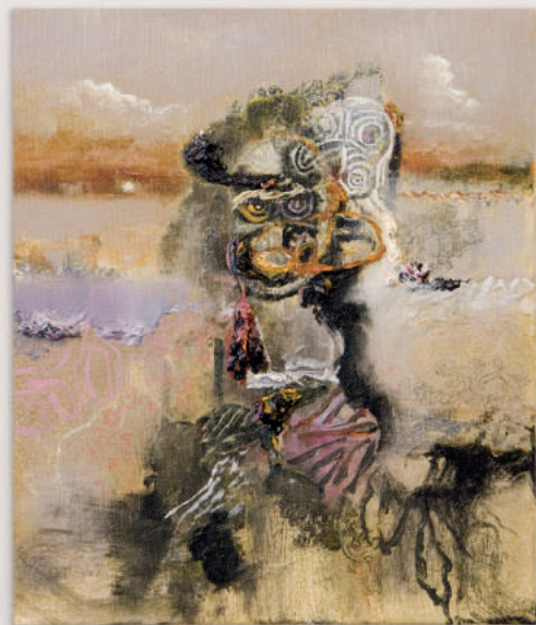
SPIRIT WALKERS oil, acrylic, pencil on canvas 30 x 25 cm | 12 x 10 in