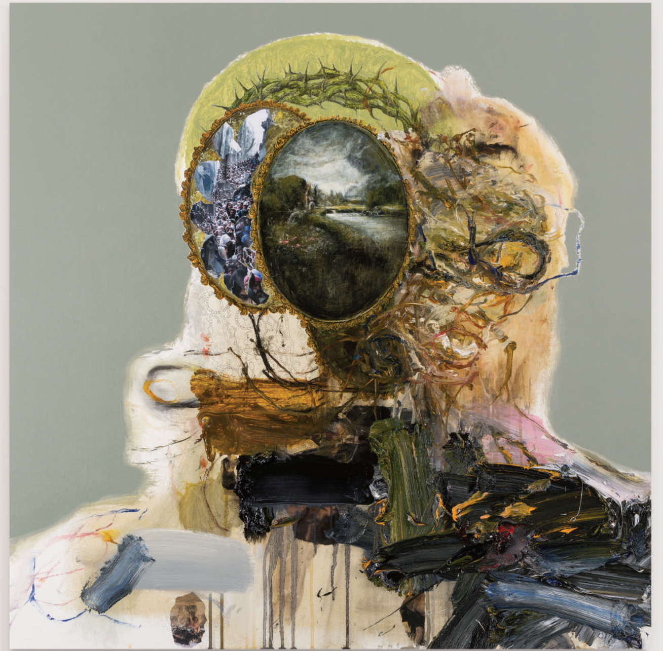
PORTRAIT FOR HUMAN PRESENCE (DAWN OF THE DYING CITIES)

oil, acrylic, collage, pencil on primed wood panel . 92 x 92 cm | 36 x 36 in