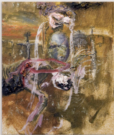
TWILIGHT MOVEMENTS oil, acrylic, pencil on canvas 30 x 25 cm | 12 x 10 in