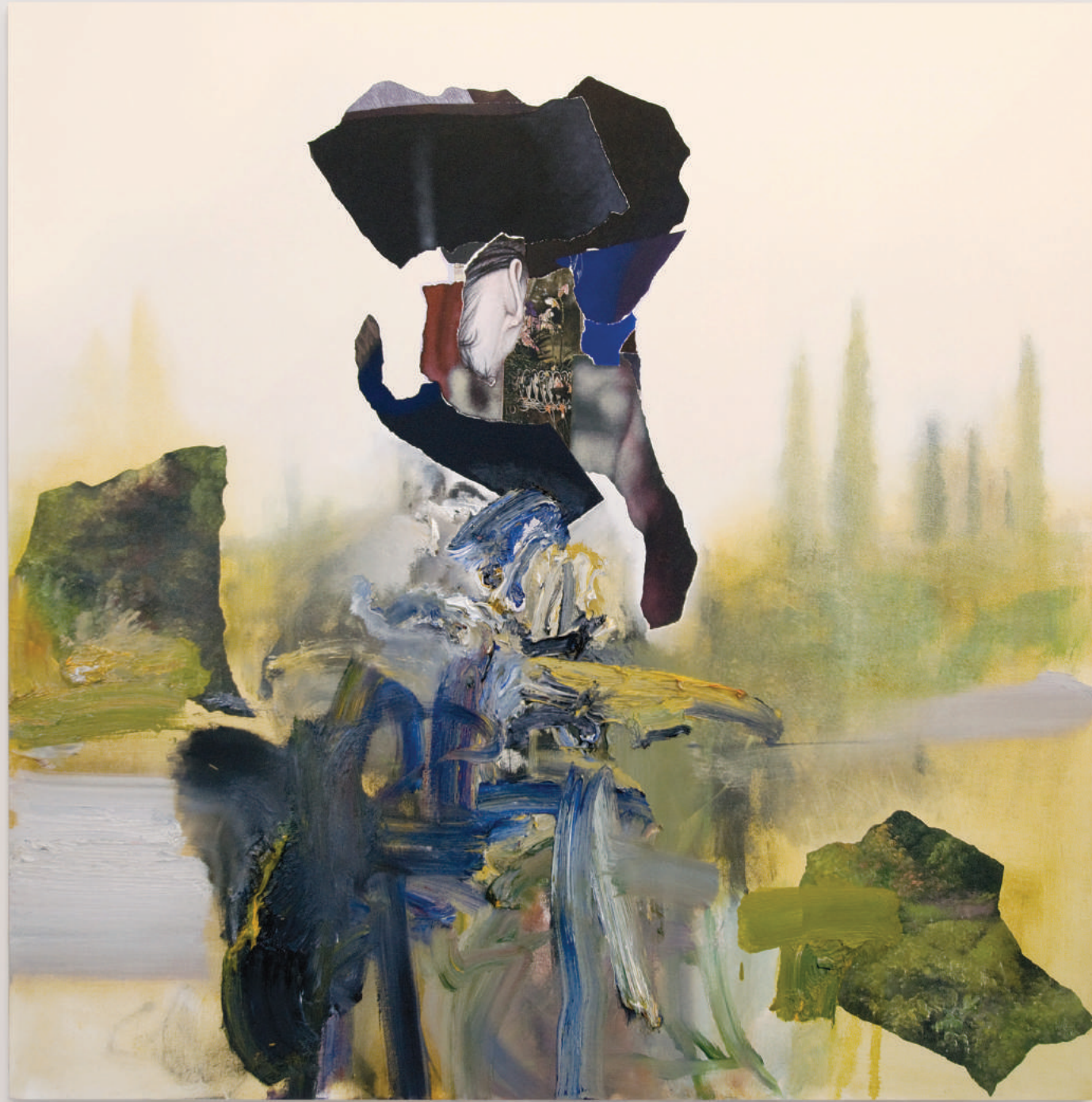
WORKING HARD IN THE GOLDEN MONTH, PROVENCE (MALE) oil and acrylic on canvas . 122 x 122 cm | 48 x 48 in