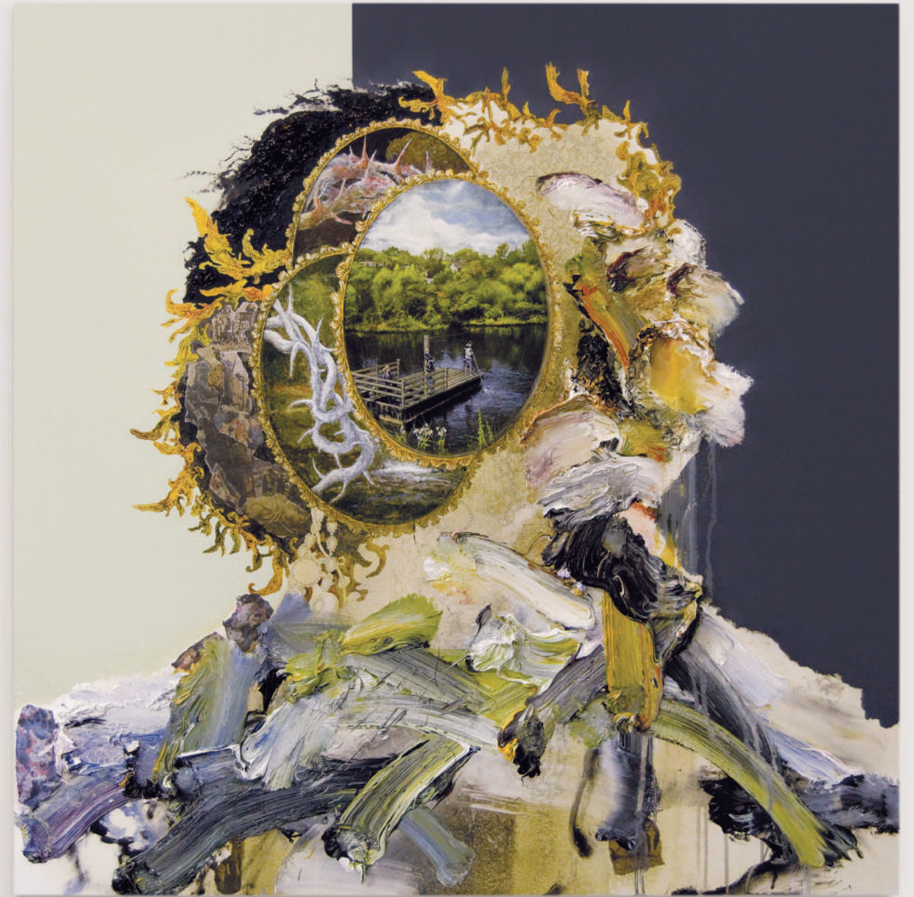
PORTRAIT FOR HUMAN PRESENCE (STAY ABOVE) oil, acrylic, collage, pencil on primed wood panel . 92 x 92 cm | 36 x 36 in