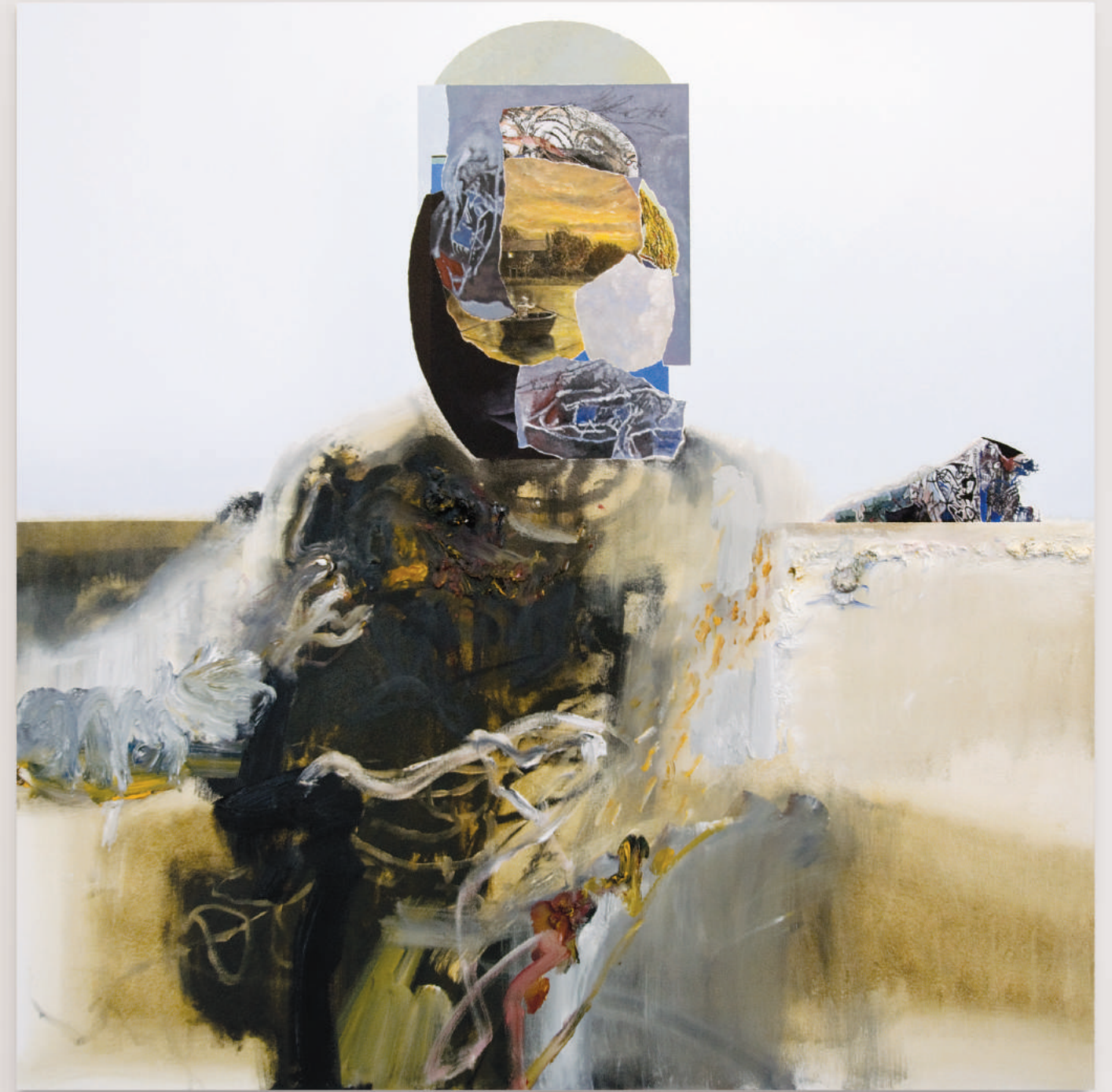
PRIEST IN PREPARATION

oil and acrylic on canvas . 122 x 122 cm | 48 x 48 in