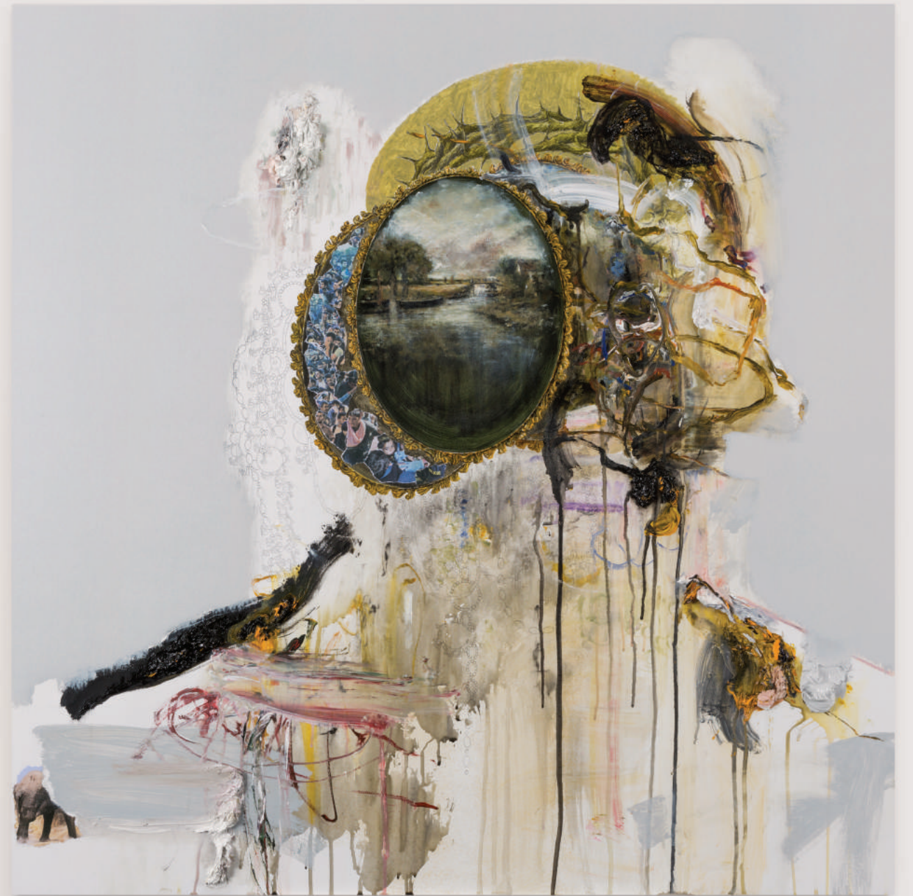
PORTRAIT FOR HUMAN PRESENCE (THE DISPLACED II) oil, acrylic, collage, pencil on primed wood panel . 92 x 92 cm | 36 x 36 in