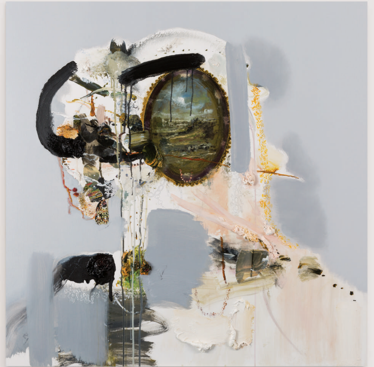
PORTRAIT FOR HUMAN PRESENCE (ASILANOM) oil, acrylic, collage, pencil on primed wood panel . 92 x 92 cm | 36 x 36 in