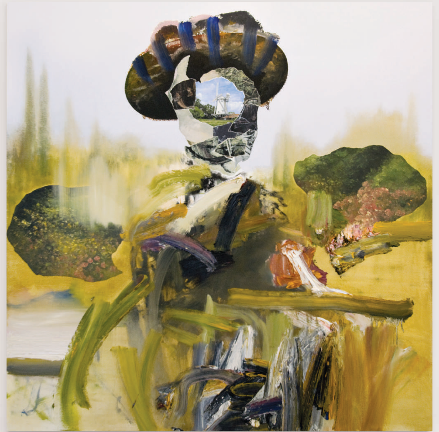
WORKING HARD IN THE GOLDEN MONTH, PROVENCE (FEMALE) oil and acrylic on canvas . 122 x 122 cm | 48 x 48 in