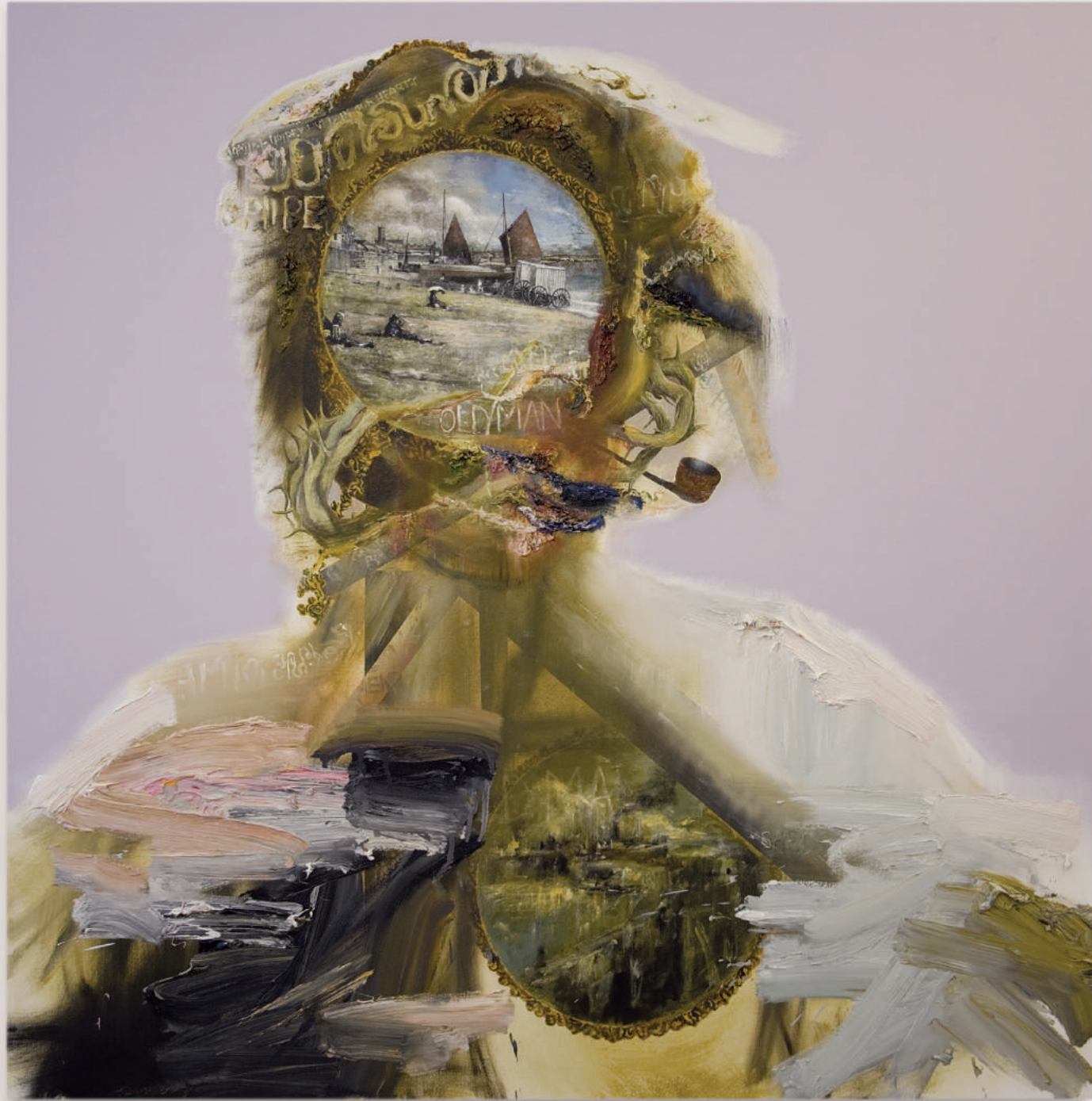
OLD MAN PIPEY

oil and acrylic on canvas . 122 x 122 cm | 48 x 48 in