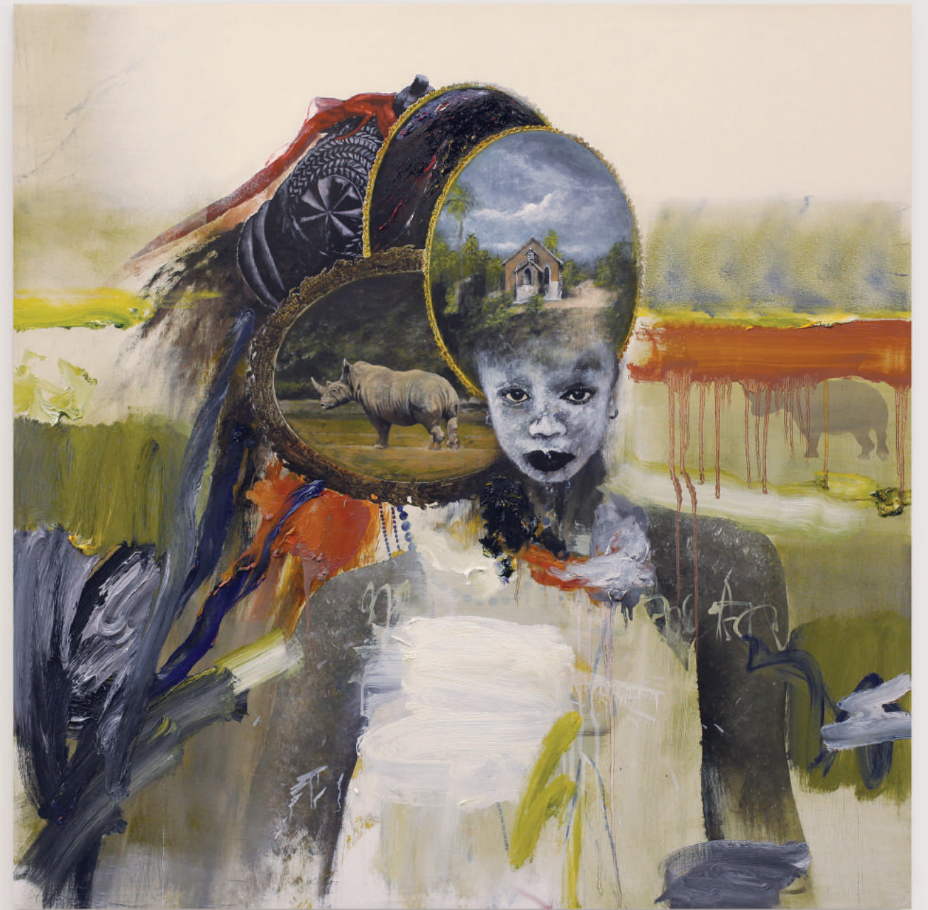
GIRLS OF THE SIERRA LEONE IV

oil, acrylic, pencil on primed wood panel . 92 x 92 cm | 36 x 36 in