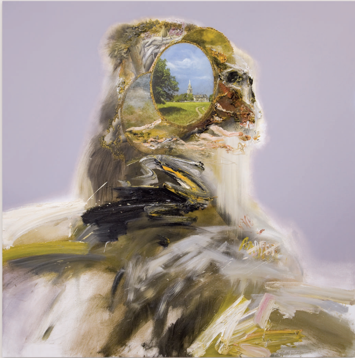
THE PARANOIA DIVA

oil and acrylic on canvas . 122 x 122 cm | 48 x 48 in