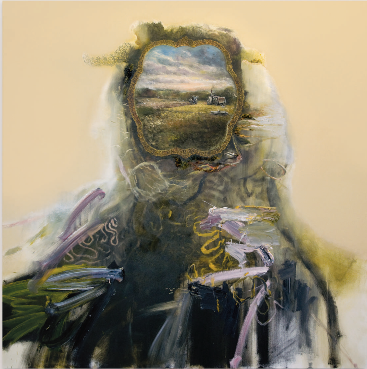
INHERENT EROTICISM IN ALL TRANSFORMATIONS oil and acrylic on canvas . 152 x 152 cm | 60 x 60 in