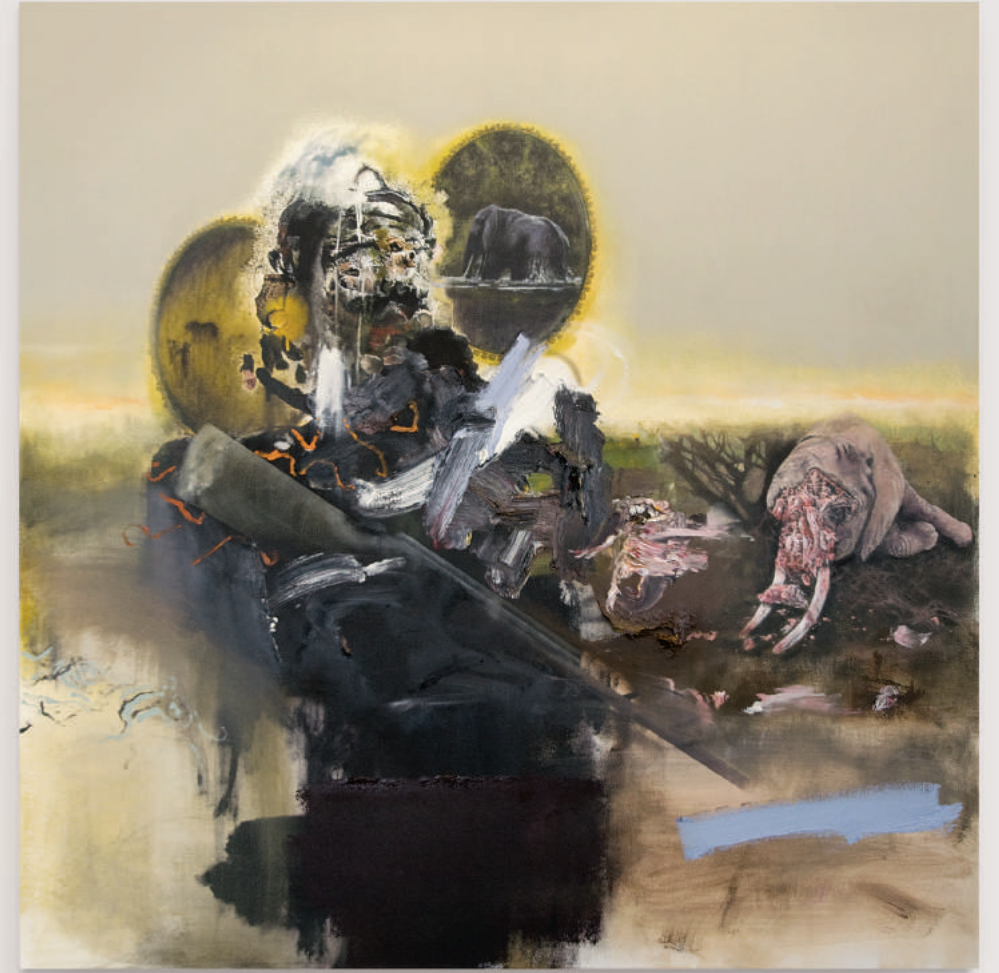
THE GREAT GREY MOTHERS I oil and acrylic on canvas . triptych (each panel): 122 x 122 cm | 48 x 48 in