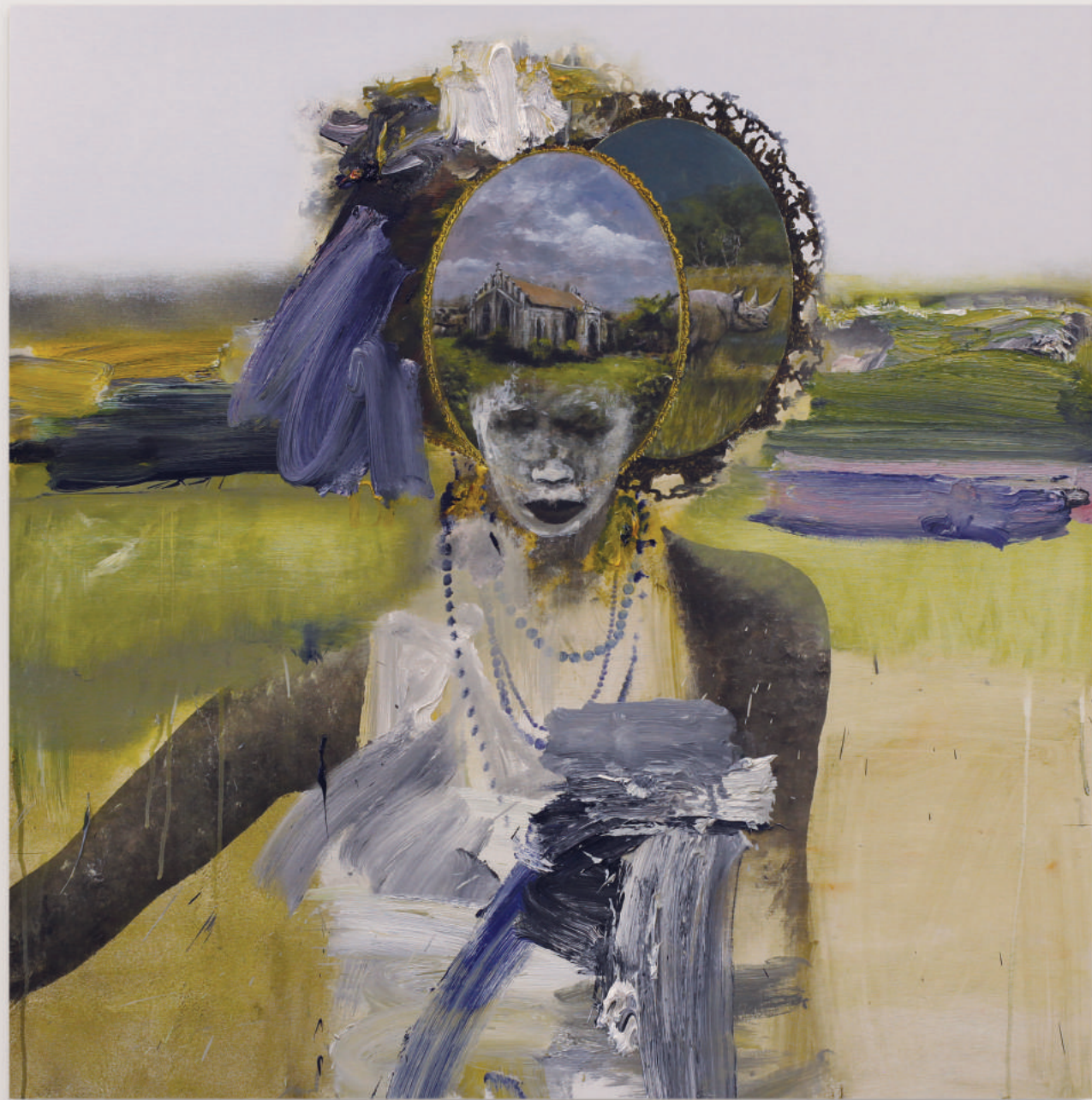
GIRLS OF THE SIERRA LEONE I oil, acrylic, pencil on primed wood panel . 92 x 92 cm | 36 x 36 in