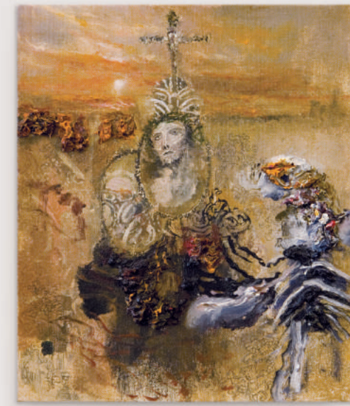
NATURE STRIPS ALL oil, acrylic, pencil on canvas 30 x 25 cm | 12 x 10 in