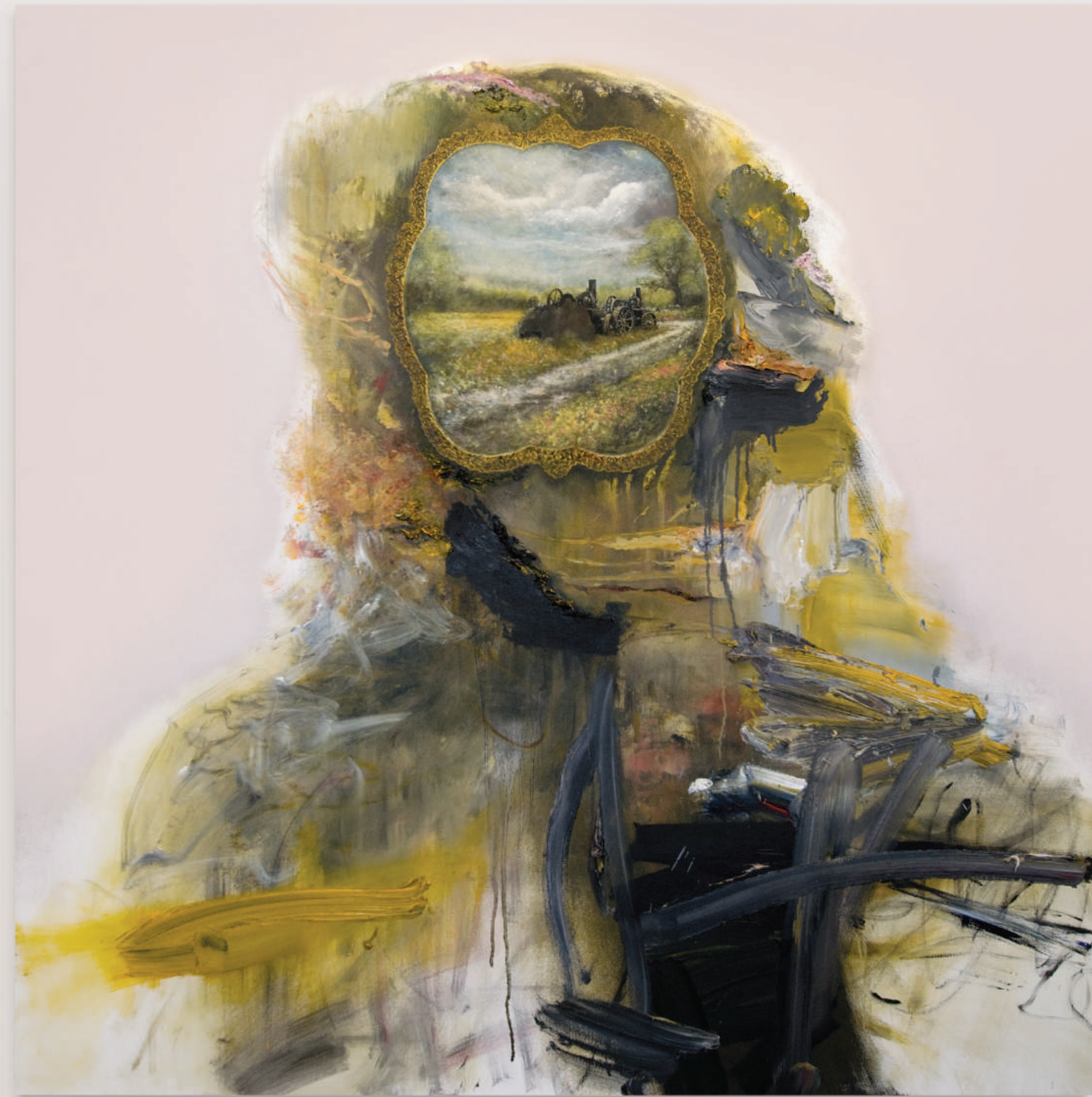
FOWLERS IN THE FIELD

oil and acrylic on canvas . 152 x 152 cm | 60 x 60 in