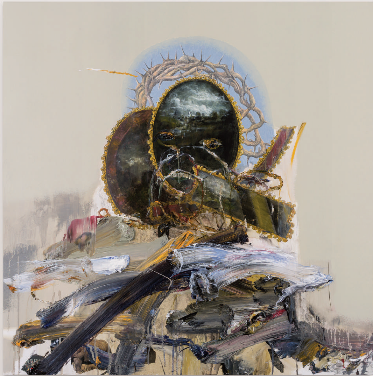
PORTRAIT FOR HUMAN PRESENCE (UPON THIS EARTH)

oil, acrylic, collage, pencil on primed wood panel . 92 x 92 cm | 36 x 36 in