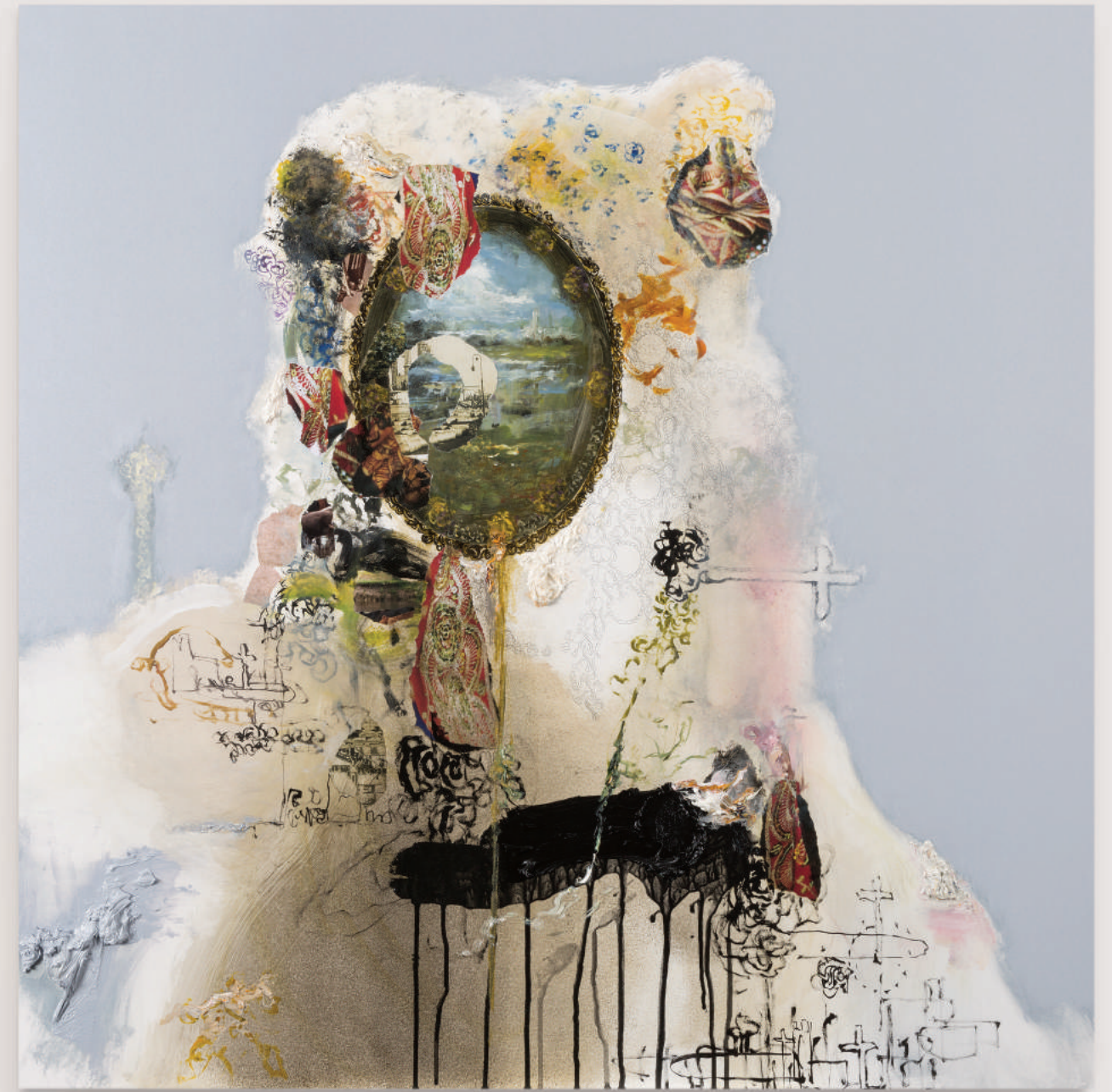
PORTRAIT FOR HUMAN PRESENCE (II)

oil, acrylic, collage, pencil on primed wood panel . 92 x 92 cm | 36 x 36 in