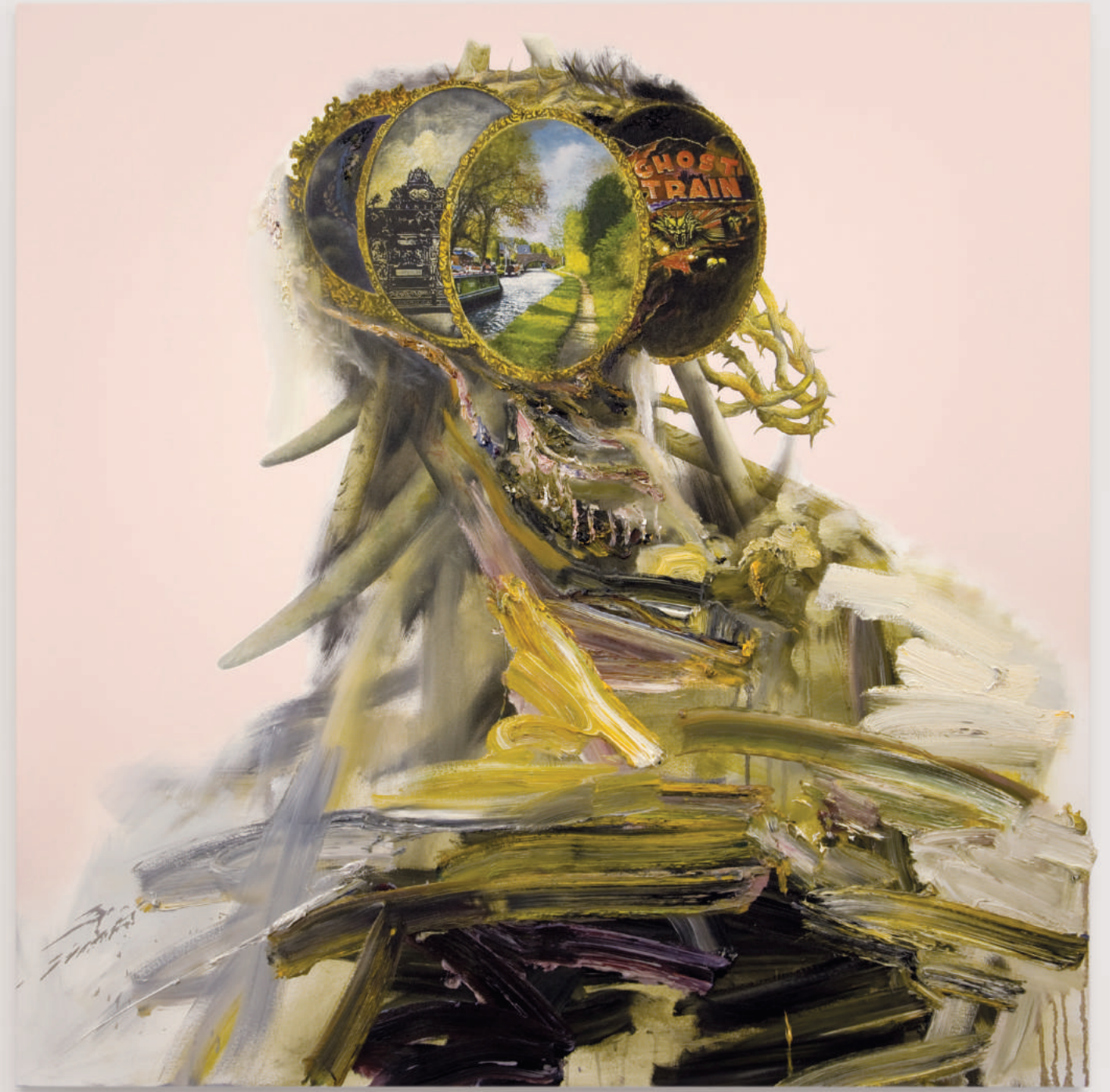
RENAISSANCE OF THE INSANE oil and acrylic on canvas . 122 x 122 cm | 48 x 48 in