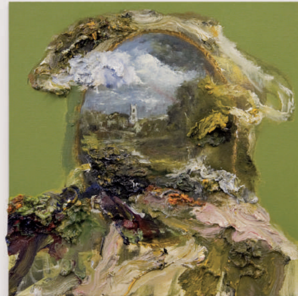
A WARM PRIMAL SKY oil and acrylic on canvas 40 x 40 cm | 16 x 16 in