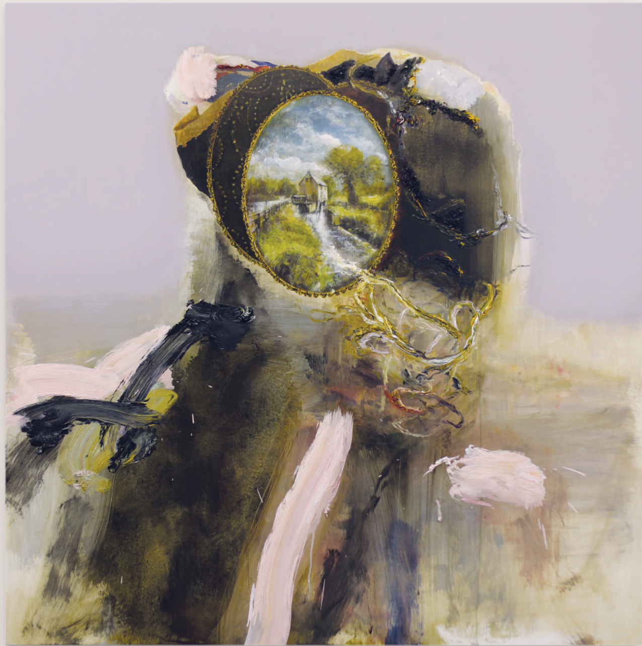
AN UNDER BEAUTY

oil, acrylic, pencil on primed wood panel . 92 x 92 cm | 36 x 36 in