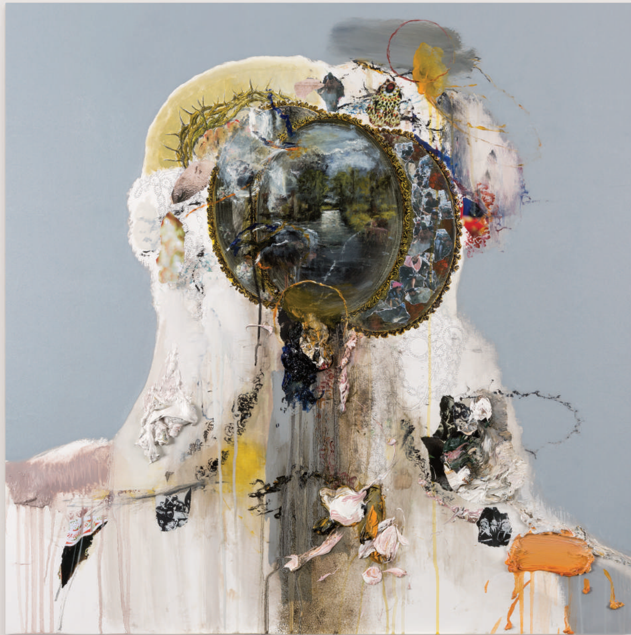
PORTRAIT FOR HUMAN PRESENCE (THE DISPLACED I) oil, acrylic, collage, pencil on primed wood panel . 92 x 92 cm | 36 x 36 in