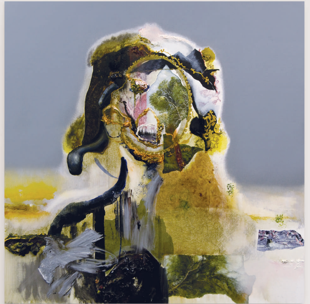
HALLUCINATING GIRLS FROM AFRICA (THE FUTURE IS NOT SET) oil, acrylic, pencil on primed wood panel . 92 x 92 cm | 36 x 36 in