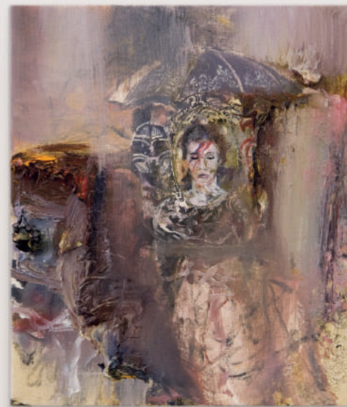
SHRINE oil, acrylic, pencil on canvas 30 x 25 cm | 12 x 10 in