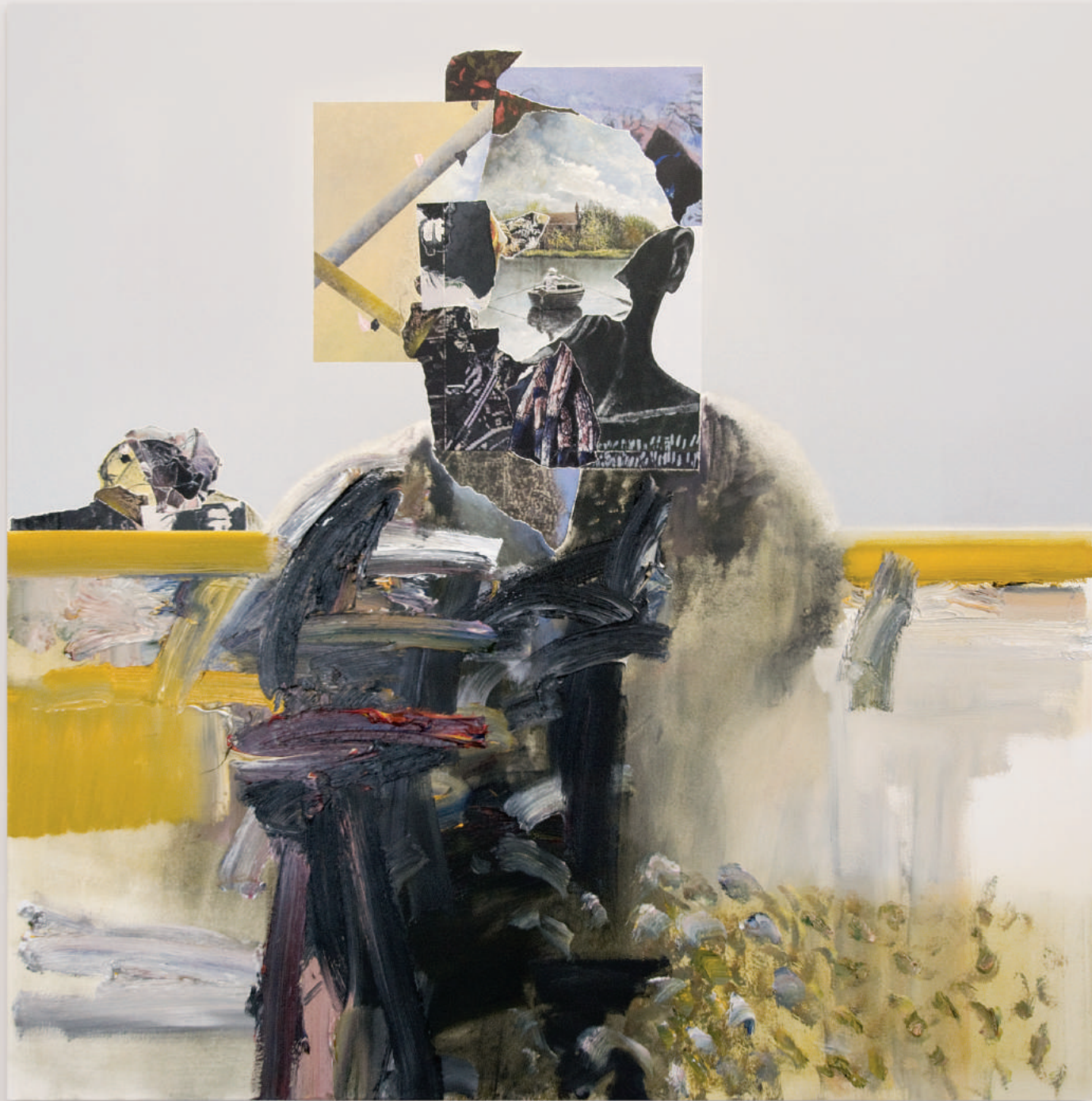
PRIEST MOVING TOWARDS

oil and acrylic on canvas . 122 x 122 cm | 48 x 48 in