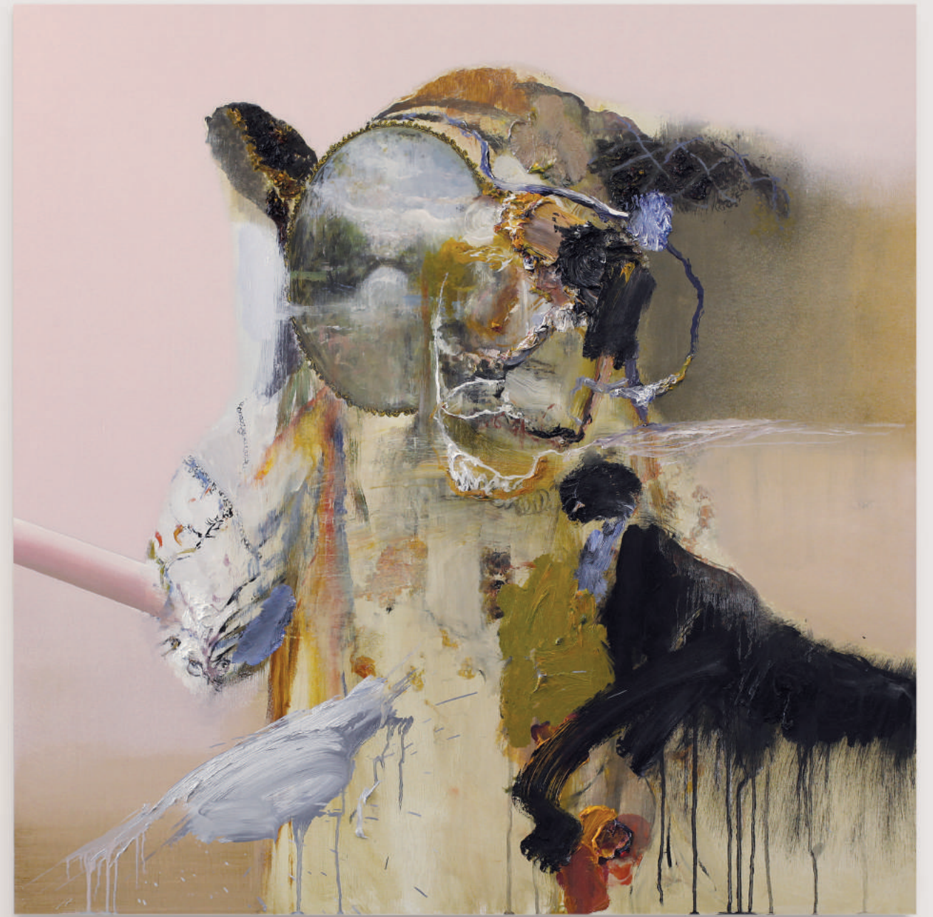
CARRIAGE OF A TURNING BULL

oil, acrylic, pencil on primed wood panel . 92 x 92 cm | 36 x 36 in