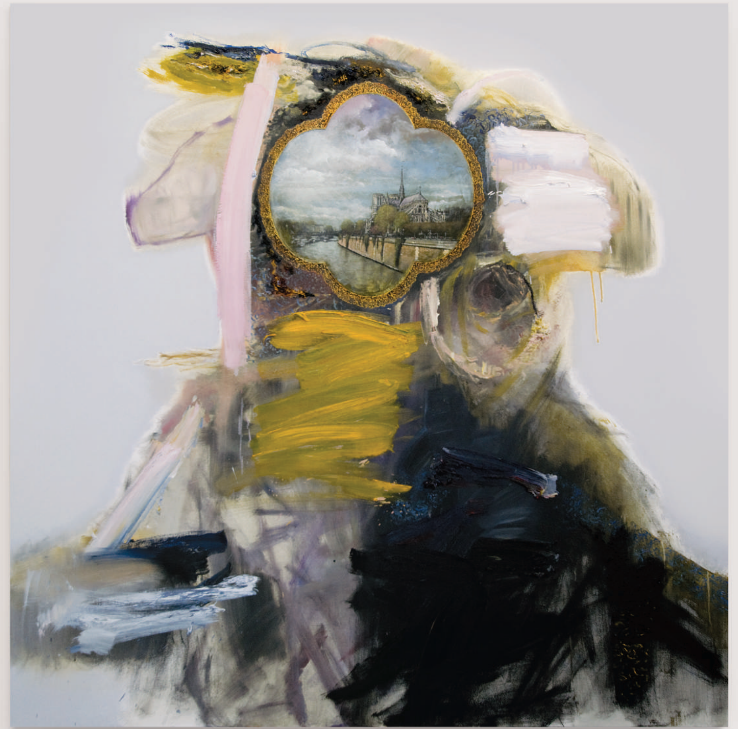
FATHER X (WATCHING FOR CLASSICAL SUNLIGHT / NOTRE-DAME)

oil and acrylic on canvas . 152 x 152 cm | 60 x 60 in