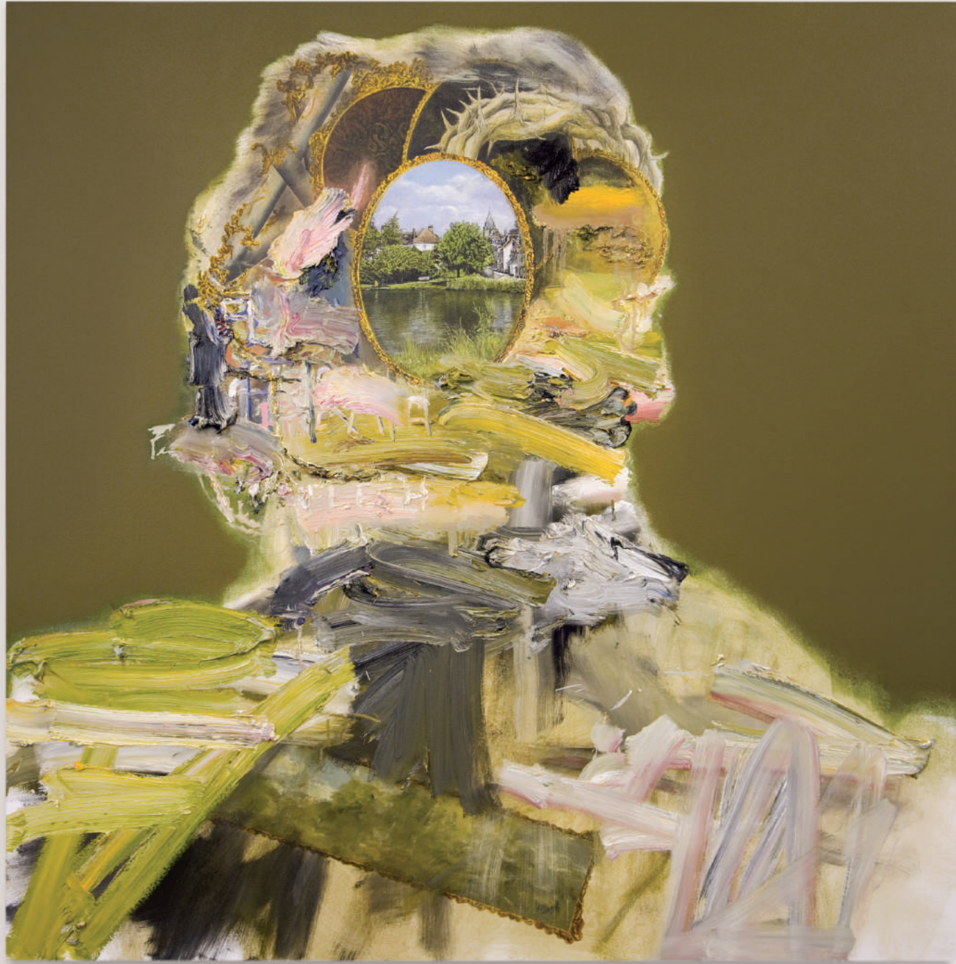
THE FLESH AND THE LANDSCAPE oil and acrylic on canvas . 122 x 122 cm | 48 x 48 in