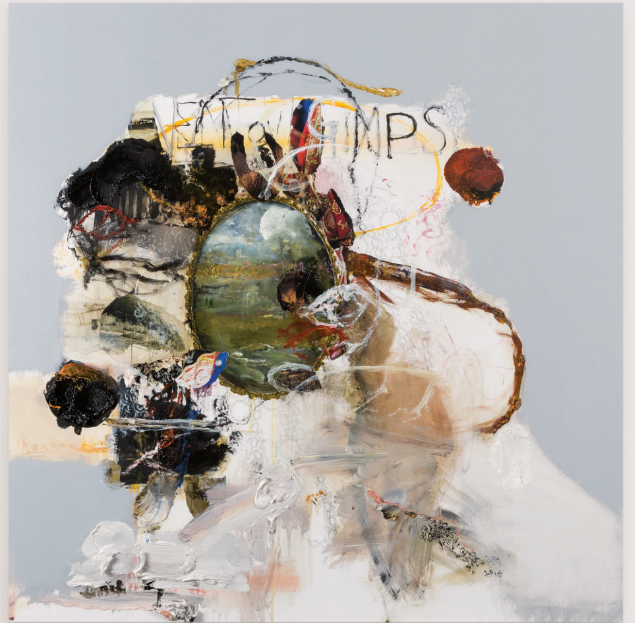
PORTRAIT FOR HUMAN PRESENCE (IV)

oil, acrylic, collage, pencil on primed wood panel . 92 x 92 cm | 36 x 36 in