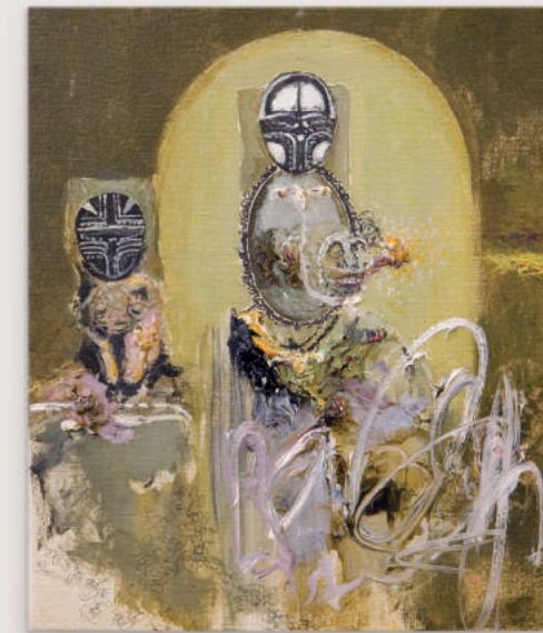
OUR DAYS IN THE FLESH oil, acrylic, pencil on canvas 30 x 25 cm | 12 x 10 in