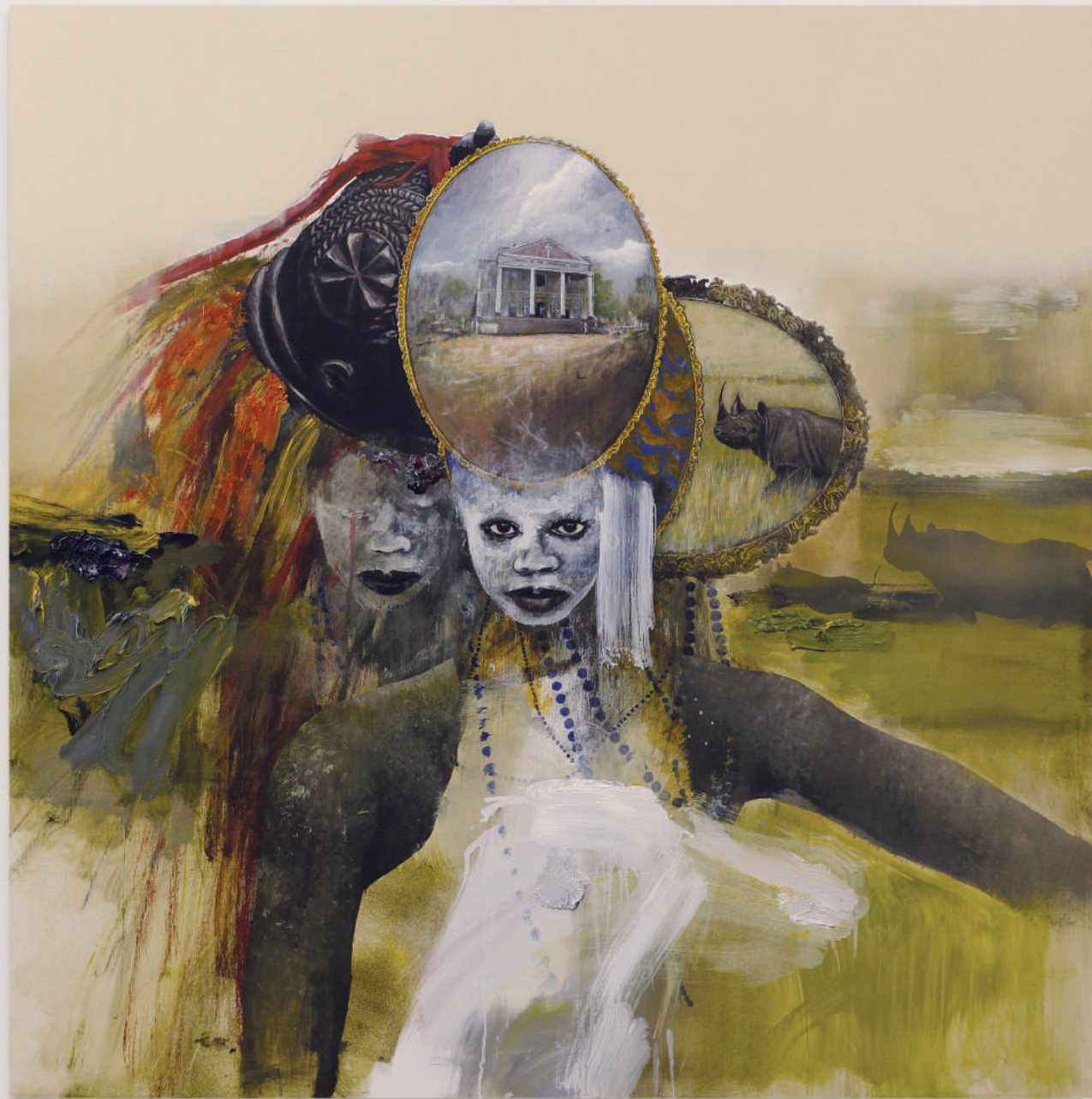
GIRLS OF THE SIERRA LEONE III

oil, acrylic, pencil on primed wood panel . 92 x 92 cm | 36 x 36 in