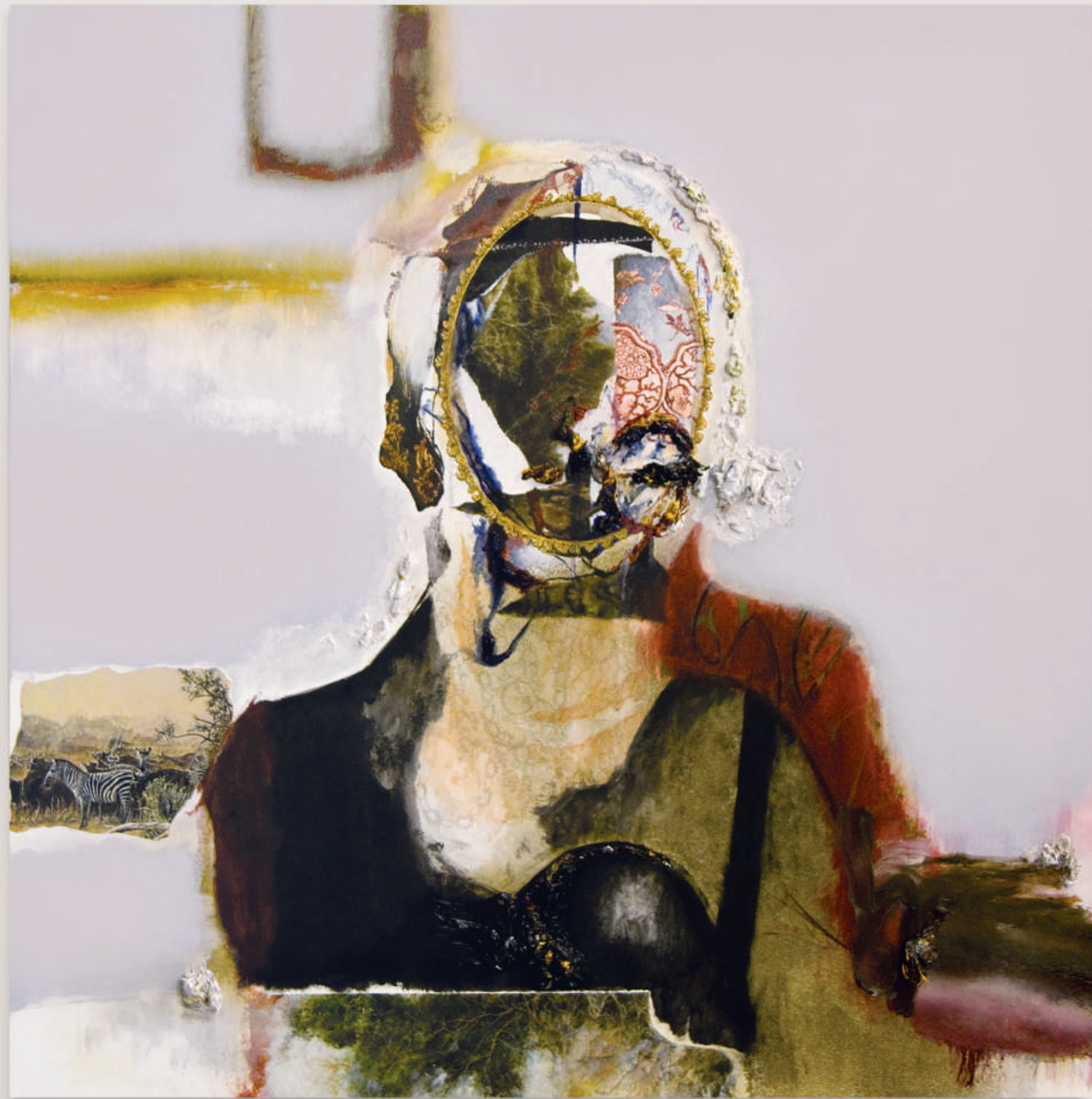
HALLUCINATING GIRLS FROM AFRICA (SEARCH IN THE HERDS OF LIFE BUT IT IS WITHIN YOU, YOUR HEART) oil, acrylic, pencil on primed wood panel . 92 x 92 cm | 36 x 36 in