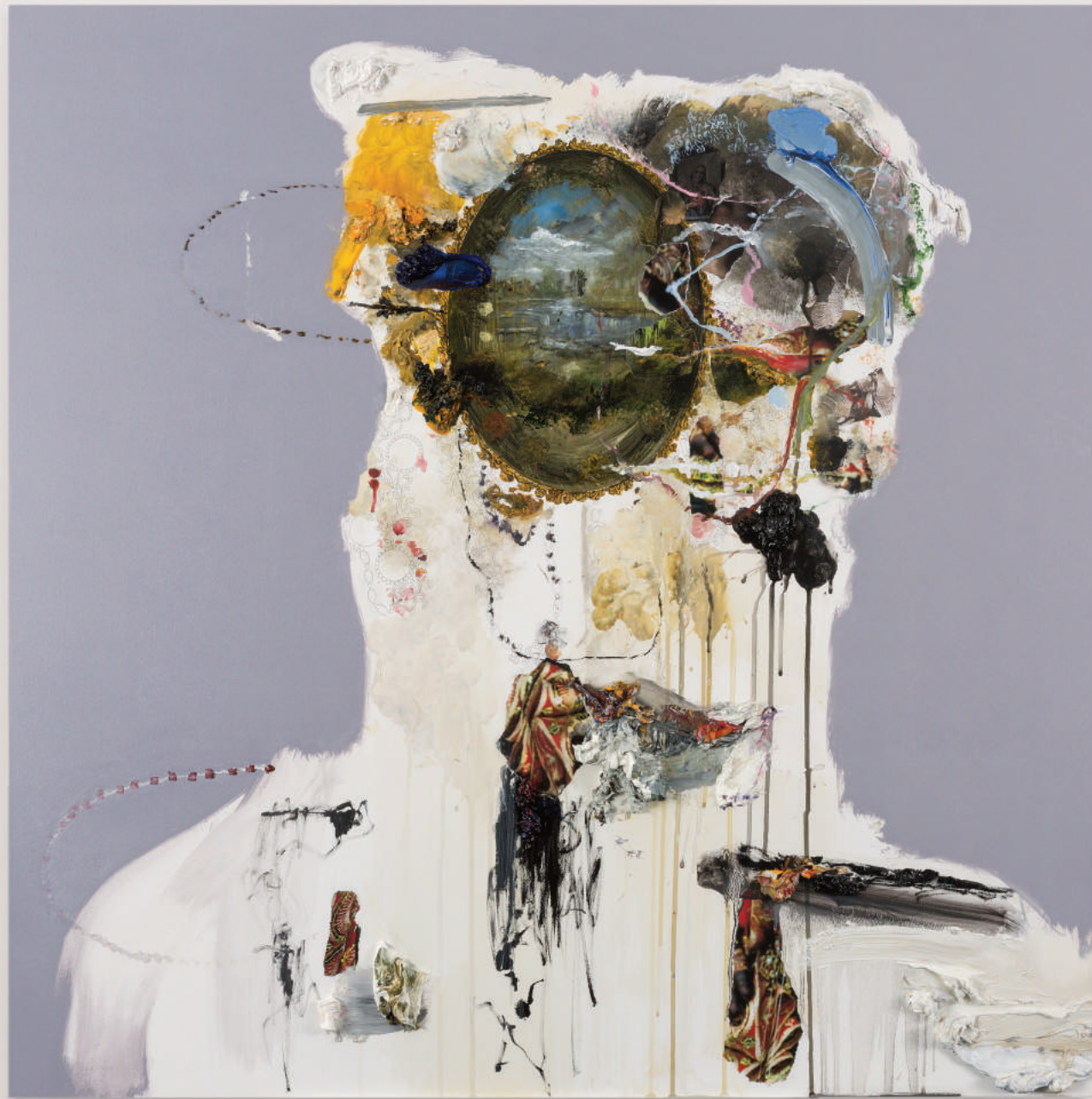
PORTRAIT FOR HUMAN PRESENCE (STATION OF ANIMAL) oil, acrylic, collage, pencil on primed wood panel . 92 x 92 cm | 36 x 36 in